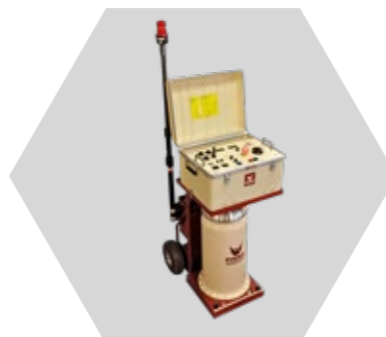
HIPOT - AC