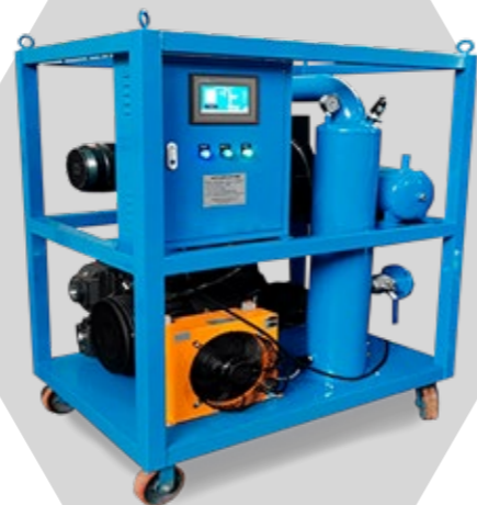
BOMBA DE VACÍO