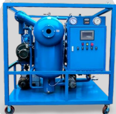
MÁQUINA DE TRATAMIENTO